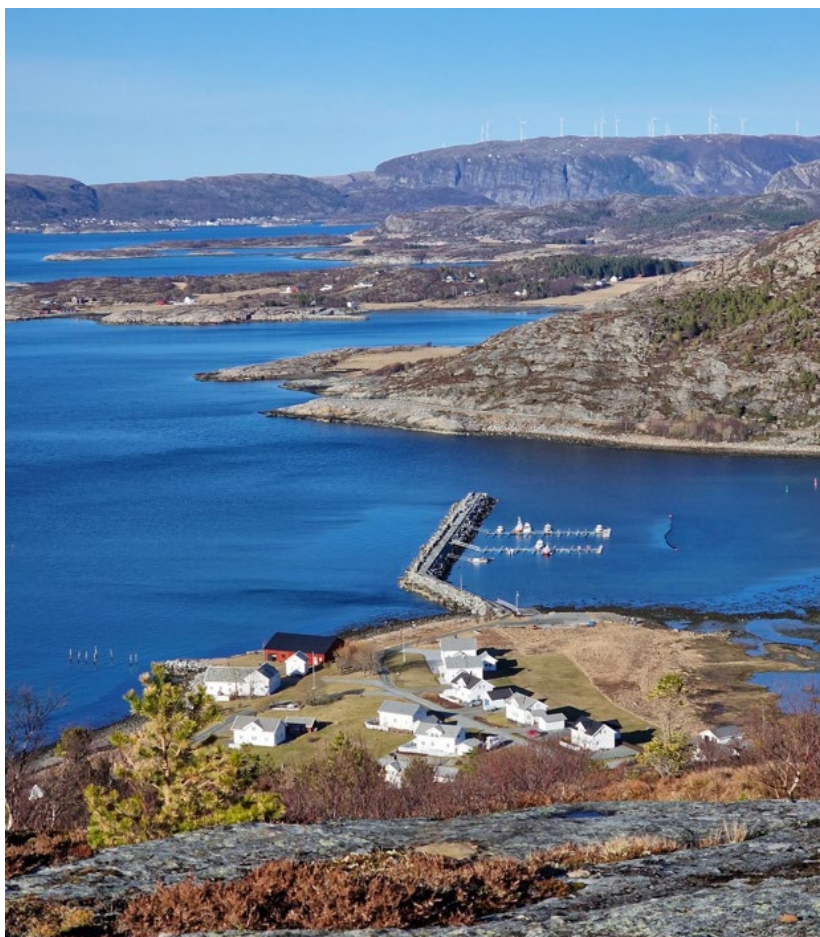
Hyttebebyggelsen og småbåthavna i Ratvika sett fra Nordåsen